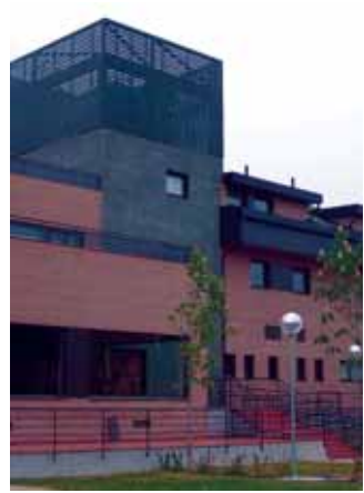
La nueva residencia está en Los Robles

El nuevo centro geriátrico, dotado con amplios servicios y tecnología moderna, fue inaugurado el pasado 28 de abril por el alcalde, Carlos Galbeño. La dirección del centro y el Ayuntamiento han firmado un Convenio cuyo objetivo es la rápida integración de la residencia en el entramado social de Torrelodones. Para lograrlo, se llevarán a cabo iniciativas como facilitar la incorporación de personal procedente del entorno y elaborar planes de formación. Además, otorgará seis plazas de precio reducido a personas designadas por el Ayuntamiento, firmará un Convenio de Concierto de