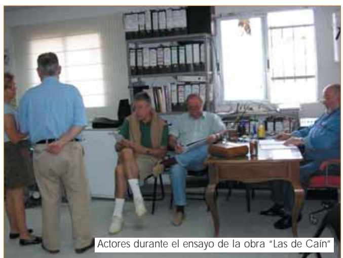
Actores durante el ensayo de la obra "Las de Caín"

Torrearte se creó en el año 1982, con lo que llevan 23 años de trabajo ininterrumpido a sus espaldas. Se creó como una Asociación cultural sin ánimo de lucro, y así empezaron a hacer teatro. Hasta mayo de 2005 han estrenado más de 50 títu-