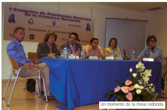
Un momento de la mesa redonda.