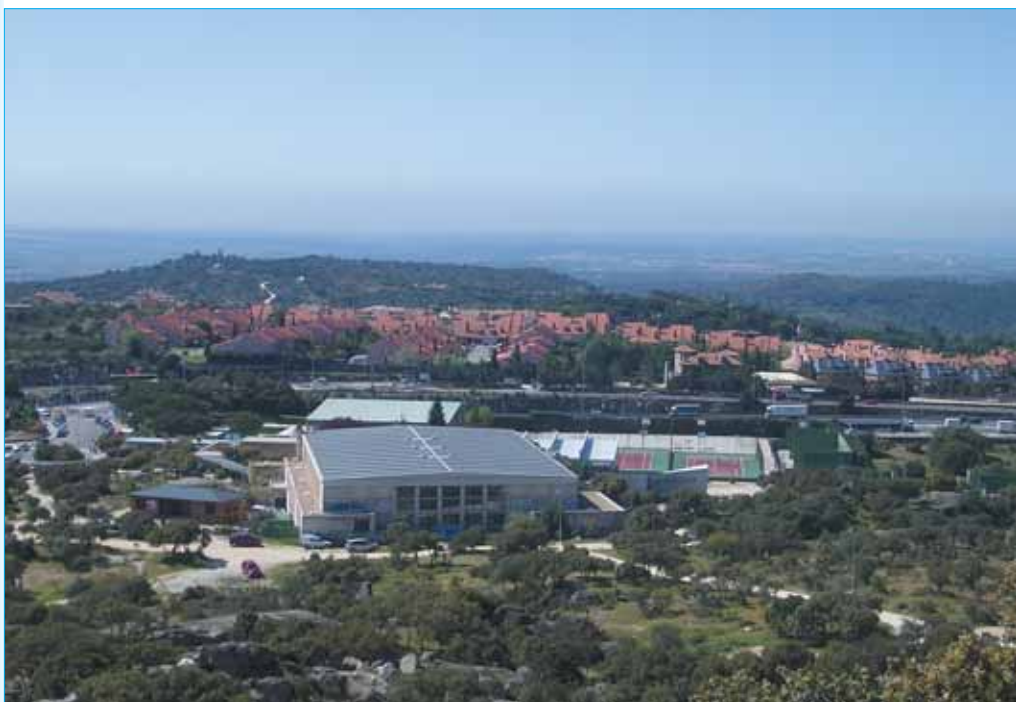
Vista del polideportivo municipal y su entorno

En el año 87 se construye el pabellón grande, pero hay que esperar hasta el 95 para ver la piscina cubierta. De este mismo año son también las dos pistas de squash y las dos de pádel. La última obra en extensión fue en el año 98 con otras dos pistas de pádel. De aquí en adelante las mejoras han sido por dentro, aprovechando mejor el espacio que ya se tenía: salas de aeróbic, más vestuarios, ampliación de la sala de