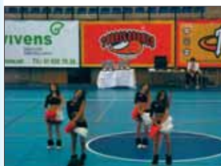
Animadoras del equipo de Torrelodones

El encuentro finalizó con la victoria del Cimaga Torrelodones por 46 a 37 al Real Madrid. Una gran victoria del Cimaga Torrelodones que realizó un magnífico papel. Enhorabuena!