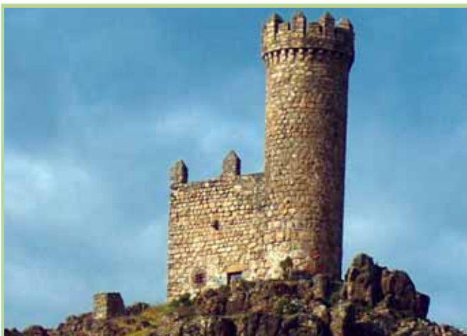
El símbolo de Torrelodones es una torre-vigia del siglo IX