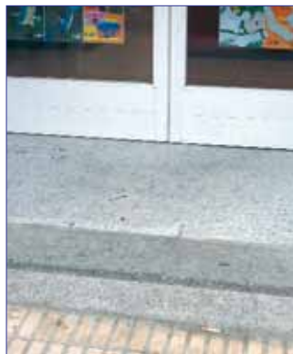
Algunos de los obstáculos: rampas demasiado inclinadas, aceras estrechas y sin rebaje, escalones ...