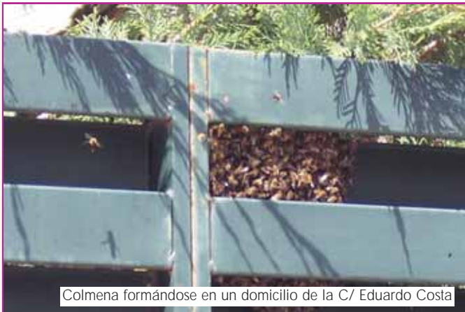
Colmena formándose en un domicilio de la C/ Eduardo Costa

Como curiosidad, contar que el enjambre de abejas está formado por obreras (que pueden llegar a ser miles); una reina que es la madre de todas y un reducido número de zánganos, los machos. La reina pone un huevo en cada celdilla del panal pero, paradójicamente, no es ella la que reina el enjambre. Esta función recae en las obreras, de modo que la reina está sometida a las órdenes de sus propias hijas, que le marcan el ritmo de trabajo (la puesta de huevos). Puede llegar a poner hasta 3.000 huevos al día.