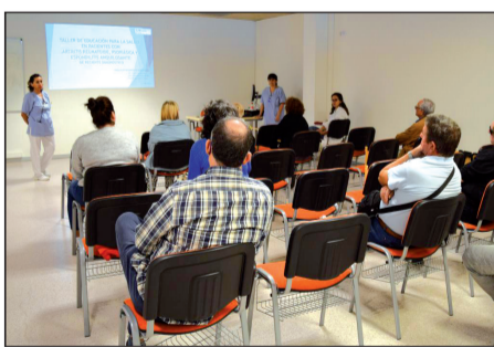
Un momento de los talleres del hospital

Para pacientes con artritis reumatoide y psoriásica, y espondilitis anquilosante