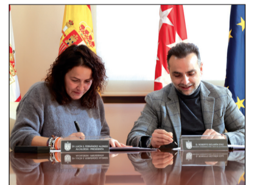
Momento de la firma del Convenio con la Hermandad del Santísimo Cristo de los Remedios

Como novedad, el Ayuntamiento aumentará la inversión destinada a este convenio, que asciende a un total de 40.000 euros, cuando hasta ahora, eran 36.000. Muy buenas noticias para los más