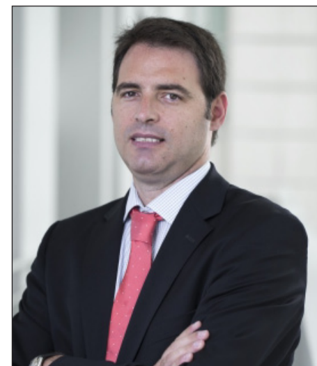
Alberto Teichmann es el director general de Volkswagen Vehículos Comerciales.

Nuestra apuesta es la movilidad eléctrica, vehículos 100% eléctricos y modelos híbridos enchufables. Tenemos el objetivo es convertirnos en la marca de referencia en soluciones de movilidad sostenible